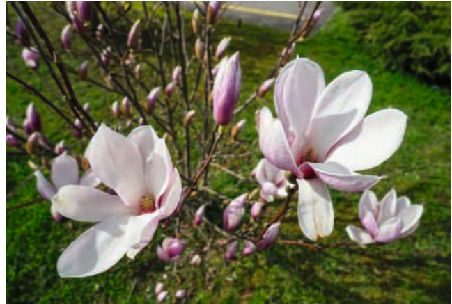
Magnolie im Frühling.