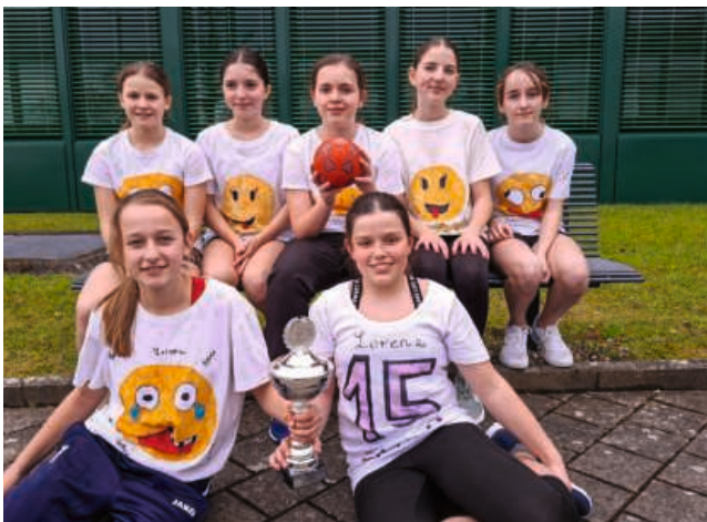
Die Gruppe Emojis gewinnen das Handballturnier