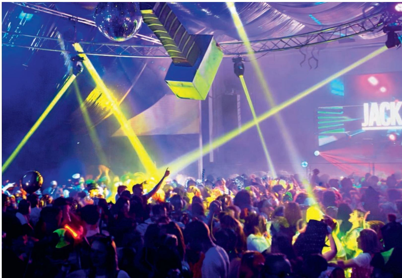
Halle der MEGA Fasnachtsparty 2026.