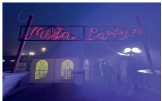
Bild rechts: Eingang der MEGA Fasnachtsparty 2026.