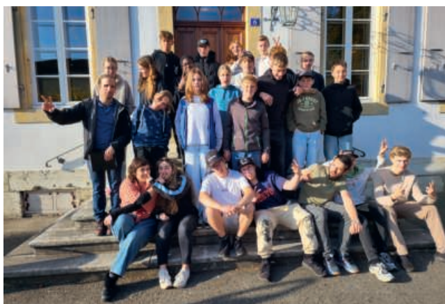
Viel Spass und Überraschungen erlebten die Oberstufenschüler im Konflager in Montmirail NE