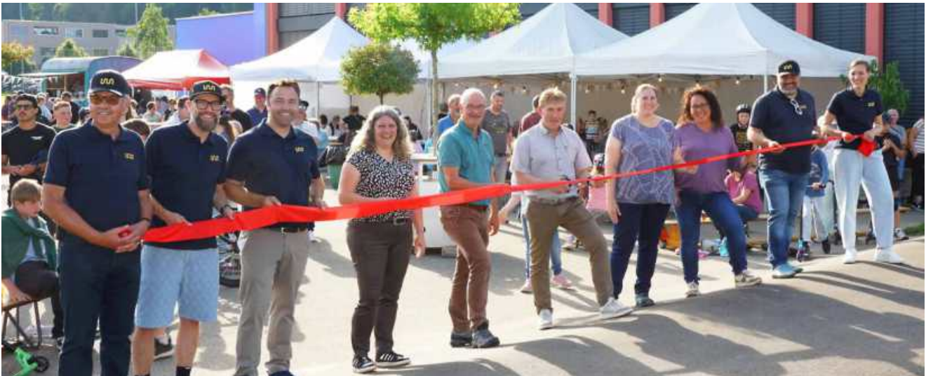
Eröffnungsfeier vom 6. Juni 2025: Gesamtfoto Arbeitsgruppe und Gemeinderat.

Mit dem Fahrplanwechsel am 14. Dezember 2025 wird das Angebot der S77 nochmals deutlich verbessert. Am Morgen während der Hauptverkehrszeit werden zwei zusätzliche Verbindungen nach Zell geführt. Damit profitieren insbesondere Pendlerinnen und Pendler von einer besseren Anbindung an das Bahnnetz, was den öffentlichen Verkehr attraktiver macht und die Mobilität in der Region stärkt.