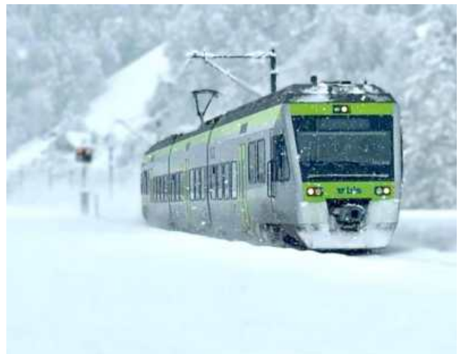
BLS zwischen Hüswil und Zell.

01.01.2026 verschoben auf Dienstag, 30.12.2025