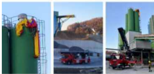
9.5.25: MAKIES-Areal als Übungsgelände der Feuerwehr.