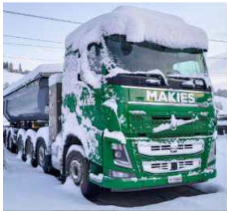
Neujahr 2025: Gute Wünsche in Weiss-Grün.

Das sind einige unserer Social-Media-Stories 2025. Top aktuelle Infos aus unserem Unternehmen finden Sie auf Instagram: @makies_baustoffe. Folgen Sie uns 😊.