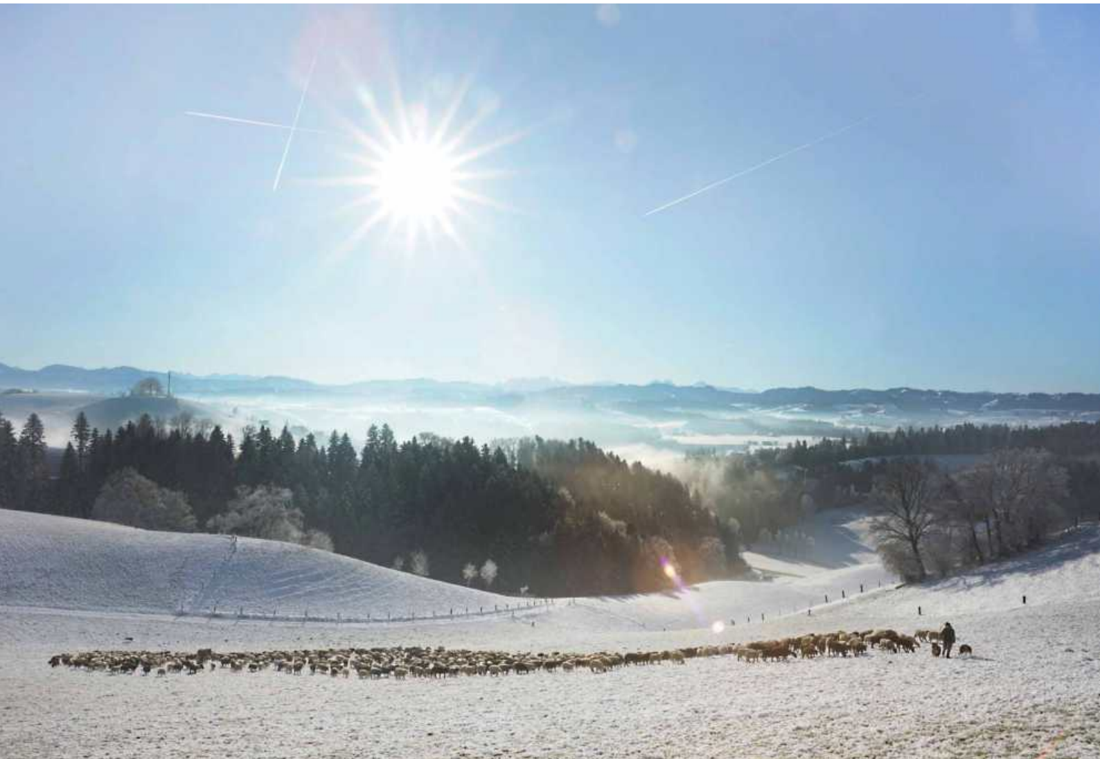
Schafherde beim Gigenhof.