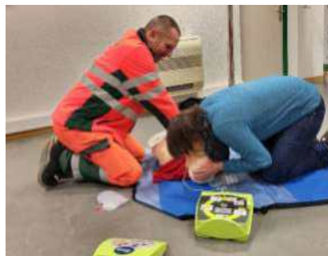
14.11.25: Nothilfe-Wissen auffrischen an der Mitarbeiterschulung von MAKIES.