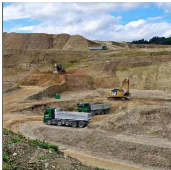
11.9.25: Swiss Miniatur? Nein, ein echter Schnappschuss aus der Kiesgrube Zell.